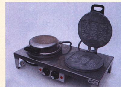
MOD. W2 – dobbelt gorojern

Vår serviceavdeling tar i mot reparasjoner og service på brukte jern.