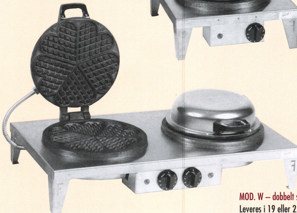
MOD. W – dobbelt stekebord Leveres i 19 eller 25 cm platediameter

Dette er markedets største jern med en stekeflate på hele 25 cm. Effekt: 1480 W